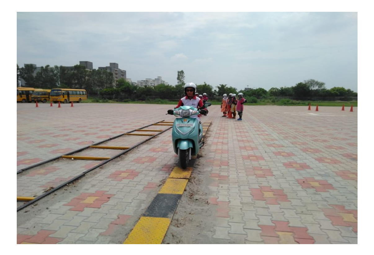
STUDENTS ARE CROSSING HURDLE IN DRIVING