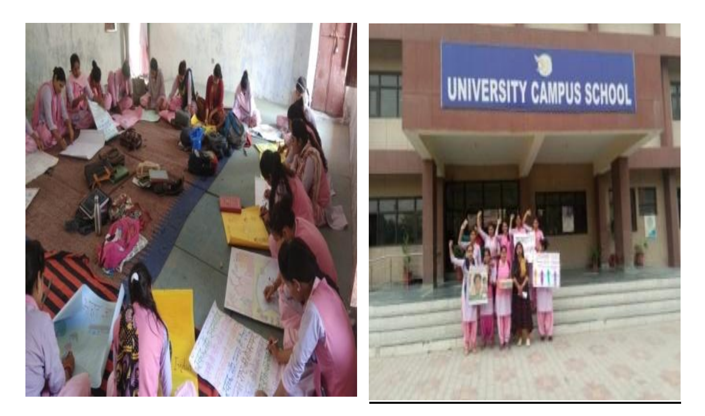
Awareness Rally on Communal Harmony (24/11/2019)