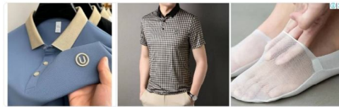
Best Quality T-Shirts

खानपुर कला, गिरवा सेनी। भगत भूल सिंह महिला विधि के समारोहम इस्तिफात अफ अगुर्वेद के शल्यतंत्र विभाग द्वारा 'आयुर्वेद मृतु रोग विज्ञान: दि मोस्ट प्रोमिसिंग एंड अमेकिंग ब्रॉच - एन एडिटेड केड अप्रोच' विषय पर एक अतिथि व्याख्यान का आयोजन किया गया।