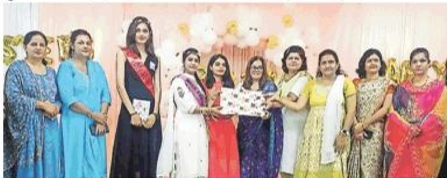
विभिन्न खिताबों से सम्मानित नवांगतुक छात्राएं।