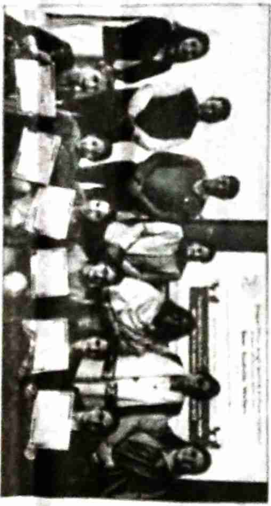
गोहरना। डिबेट का आयोजन के साथ आयोजक दल ।