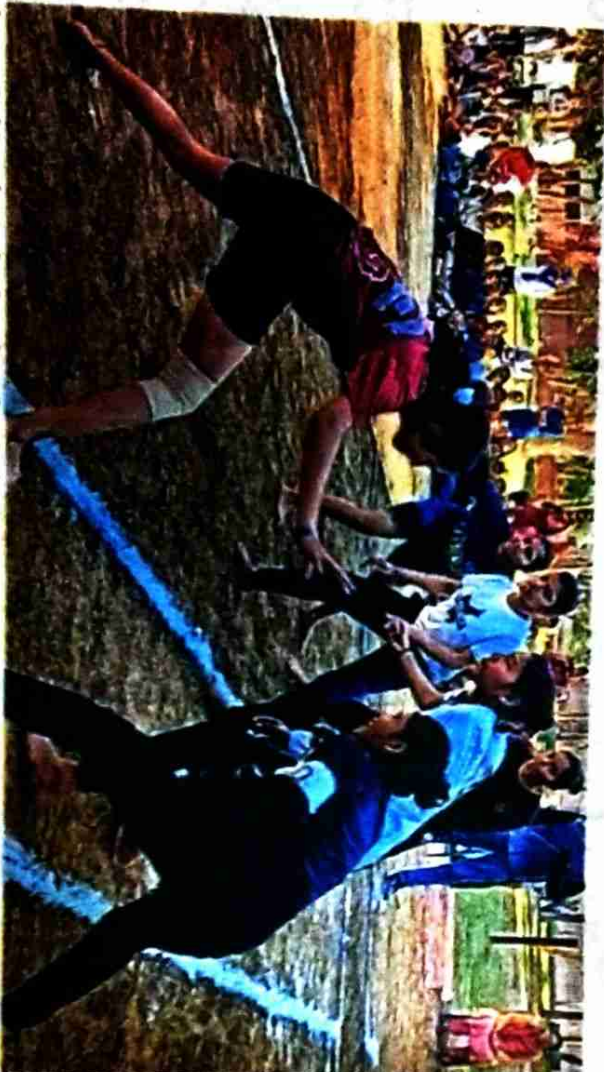
गोहरना प्रतियोगिता में अपनी प्रतिभा दिखाती छात्राएं।